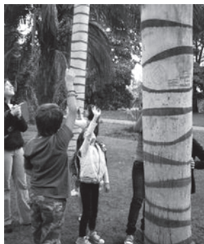
Ejercicios de Educación Medioambiental Jardín Botánico. Programa “Diseñando”, Universidad de los Andes.