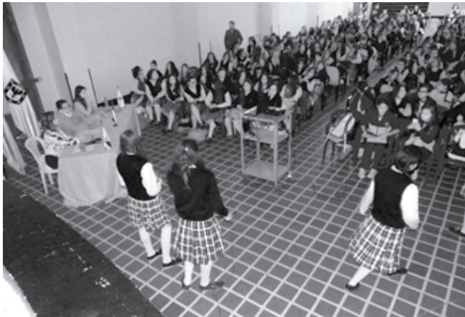
Ilustración 2. Trabajo en el colegio

Mujer y matemáticas es una experiencia que ha permitido un diálogo reflexivo con la comunidad educativa. En primer lugar, como agentes activos, las estudiantes se integran a las actividades propuestas demostrando motivación y liderazgo; el semillero de líderes encauza la experiencia otorgando nuevas dinámicas y propuestas, permitiéndoles reafirmar sus valores como mujeres que participan y representan espacios en el colegio, la familia y la sociedad.