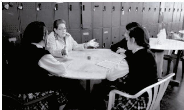
Ilustración 1. Trabajo en el aula