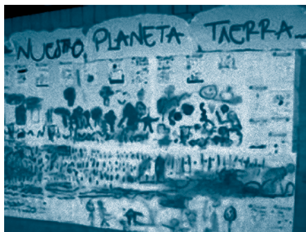
Imagen 1. Tipología ilustración, desde las temáticas de los proyectos de aula. Nuestro planeta Tierra, Gabito en mi colegio