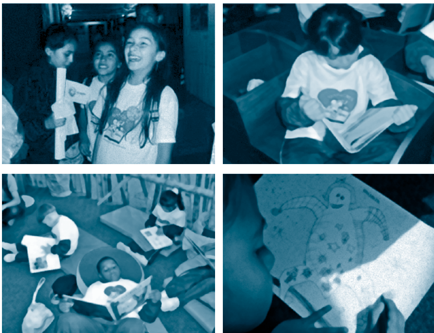
Imagen 2. Salida a la Feria del Libro de Bogotá 2011- 2012