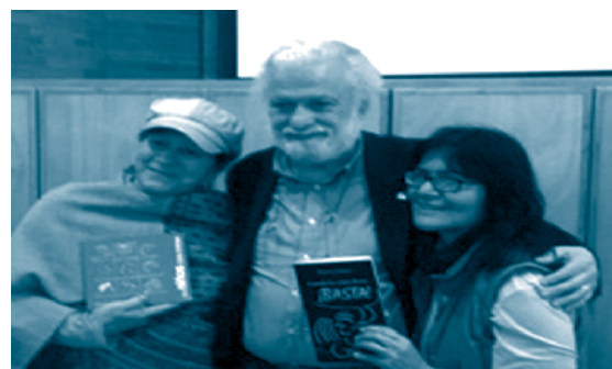
Imagen 7. Actividad de lectura; escritores al alma

El voz a voz virtual de Gabrielito Piloso también ha llegado a las familias de los estudiantes diagnosticados con Síndrome de Down, Parálisis Cerebral, Hemiplejía y Mielomeningocele del Colegio Gabriel Betancourt Mejía; confirmando el carácter inclusivo de la propuesta, en consonancia con el enfoque diferencial, que invita a maestras y maestros a profundizar en la comprensión de las niñas y niños como sujetos diferenciados y protagonistas de su desarrollo, así como de sus modos de comunicación.