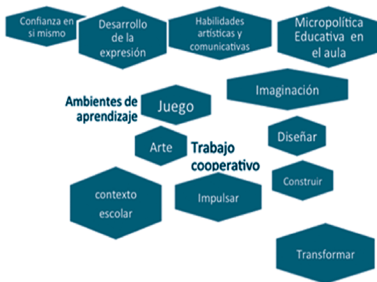
Gráfico 1. Relación entre didáctica, propósitos y pedagogía

El siguiente gráfico presenta una relación del entramado pedagógico, las didácticas y los propósitos de la experiencia.