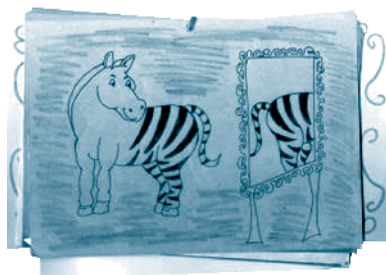
Imagen 6. La ilustración como actividad de comprensión y construcción de significado

Con ello en mente, la propuesta avanza en la tarea de llevar a los estudiantes a conquistar espacios alternos al aula. Conectar el canal Gabrielito Piloso al contexto escolar ha permitido establecer una comunicación mediada por el computador o el celular, lo cual implica, para padres, niños y niñas, integrar en un solo momento lectura, escritura, socialización, imagen y texto; sin contar con la expectativa de entusiasmo que les produce encontrar sus dibujos, familia, amigos y textos, y apreciar sus producciones a través de la pantalla.