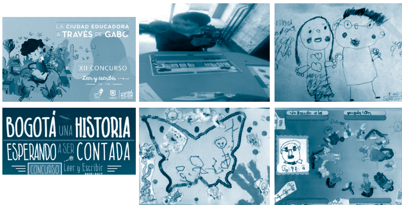
Imagen 4. Actividad de preparación para el concurso. Ilustraciones, Mis amigos y yo en trasmilenio, Remedios y Gabito visitaron mi ciudad educadora, una mariposa juguetona en Macondo, jugando a la ronda con Gabito.

En Apapaches los escritos tienen una intención comunicativa dirigida a una audiencia; el momento de participación gira alrededor de la interacción de los estudiantes con diferentes escenarios, tales como exposiciones frente a los padres de familia y la intervención en concursos institucionales, distritales, foros educativos, foros de aula o la presentación de sus textos en círculos de lectura compartida; los jurados son en ocasiones sus propios compañeros o docentes de otros cursos y también consideran los comentarios realizados en la red. La actividad intelectual de los estudiantes de jardín y transición consiste en diferenciar entre dibujo y escritura. Las rúbricas o rejillas de evaluación se convierten en la voz del auditorio que dialoga con el estudiante, permitiéndole conocer su nivel y plantearse nuevos retos en su proceso lector y de escritura.