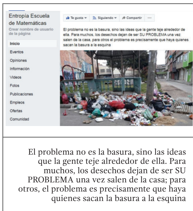
Figura 3. Fotografía y reflexión expuesta en el proyecto “Entropía. Escuela de matemáticas”

En cuanto al segundo elemento de reflexión, se destaca el hecho de que la publicación de fotografías en la página de Facebook permitió expresarse frente a la situación mediante comentarios en el pie de foto, estableciéndose diálogos referentes a las imágenes; ello propició lo que, en términos de Skovsmose (1999), se conoce como saber reflexivo, relacionado con la toma de una posición justificada en una discusión sobre asuntos tecnológicos. Es decir, al abordar el problema de las basuras, los estudiantes empiezan a reconocer la presencia de distintas variables que les impiden dar una solución simple, mientras, al tiempo, pueden emprender acciones para minimizar algunos impactos de esta mala práctica.