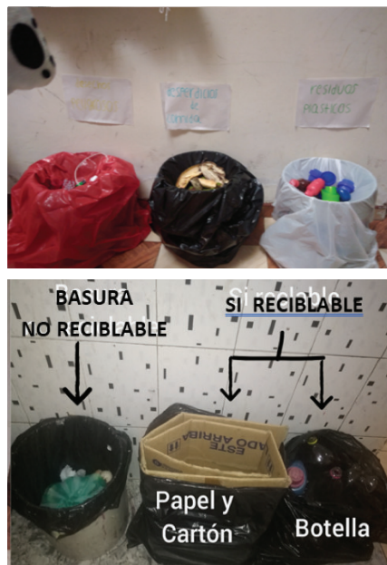
Figura 4. Separación de residuos

Una vez realizada la socialización con familiares de los estudiantes, se procedió a establecer la clasificación y separación de las basuras como una práctica cotidiana en cada una de las casas. Para ello, los estudiantes, junto con sus familias, dispusieron de un lugar en sus hogares para situar canecas de basura que funcionaran como espacio para la separación; de modo paralelo, empezaron a transformarse las prácticas de disposición de las bolsas de basura en los contenedores y lugares usados para tal fin por las comunidades.