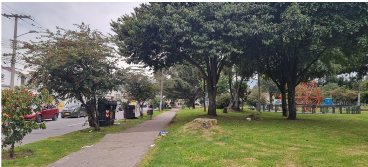
Figura 6. Espacio público desolado. Nota: espacio público sin presencia de personas

identificar, lo que contribuyó a la regulación por parte de la ciudadanía; las mujeres dirigían su mirada hacia los hombres que veían solos, a manera de censura y viceversa. Aunque por el tipo de metodología empleada no se cuantificó la cantidad de personas por la condición de género en los días de confinamiento para hombres y mujeres, esta distribución constituyó un elemento paisajístico en la ciudad no observado desde los tiempos de la administración del alcalde Mockus, cuando prohibió, en 2001, por una noche la salida de los hombres a la calle. Se observó uno que otro caso de hombres acompañando a mujeres de edad, o mujeres con hombres mayores, y una que otra persona de sexo opuesto con su mascota en algunos de los parques en los días con restricción.