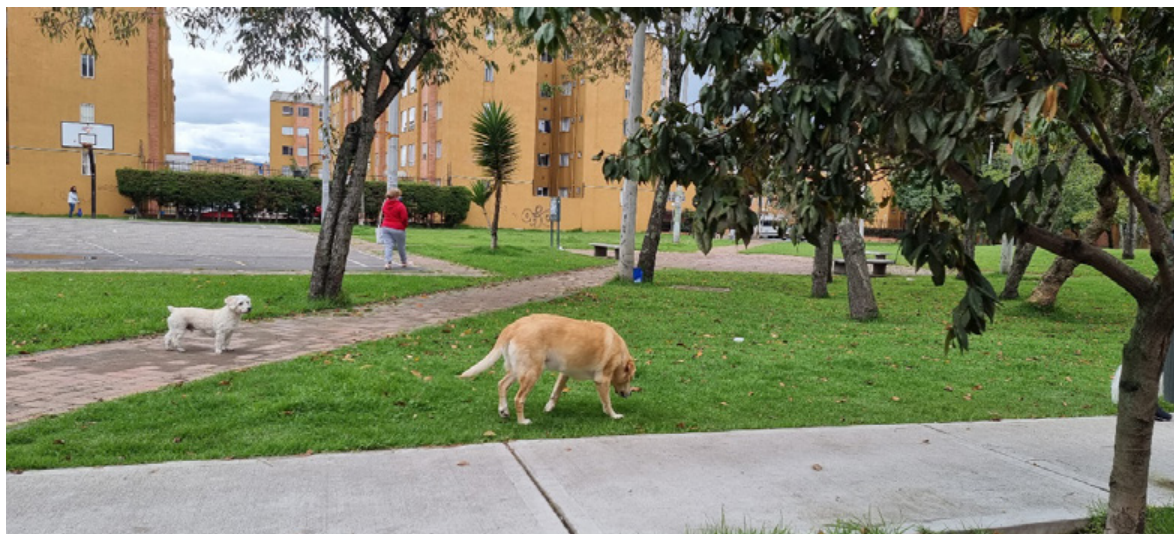
Figura 2. Parque, mujer caminando y mascotas. Nota: presencia de mujer caminando por el espacio público y de mascotas en un parque