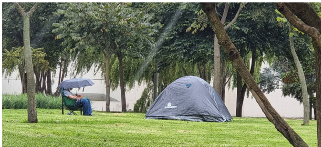
Figura 4. Hombre sentado frente a camping en un parque. Nota: hombre solo en camping en un parque

por el COVID-19, todo cambió. Como medidas preventivas de la propagación del virus, se prohibió la libre circulación de las personas por los espacios públicos, y su uso quedó condicionado a que quien saliera debería dar justificaciones estrictas, explicando necesidades de alimentación o cuidados de salud a las autoridades encargadas de regular la movilidad.