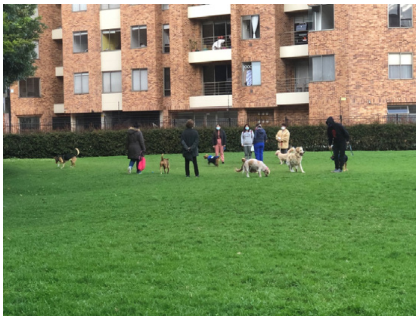
Figura 3. Parque con personas y mascotas. Nota: personas realizando actividades de paseo y juego a mascotas en un parque

económicos para aquellos que no mostraron una clara excusa para estar en la calle, ya fuera caminando o conduciendo un vehículo. Se motivó igualmente el quedarse en casa, promoviendo el ejercicio al interior de la vivienda, las actividades familiares y los encuentros virtuales. Con el tiempo, todas estas medidas se fueron relajando en su aplicación y por supuesto en su acatamiento por parte de la ciudadanía.