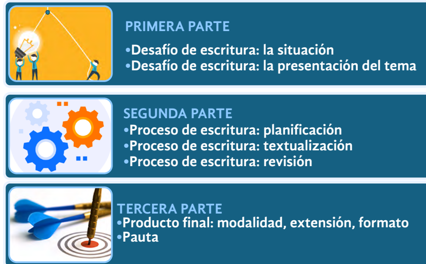
Figura 2 Etapas consideradas en el dispositivo de trabajo