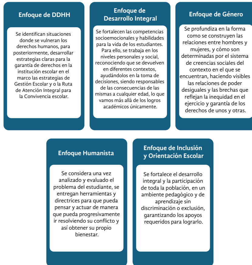
Figura 2 Enfoques de la orientación escolar en Colombia

Nota: Elaboración propia a partir del PNOE (MEN, 2021).