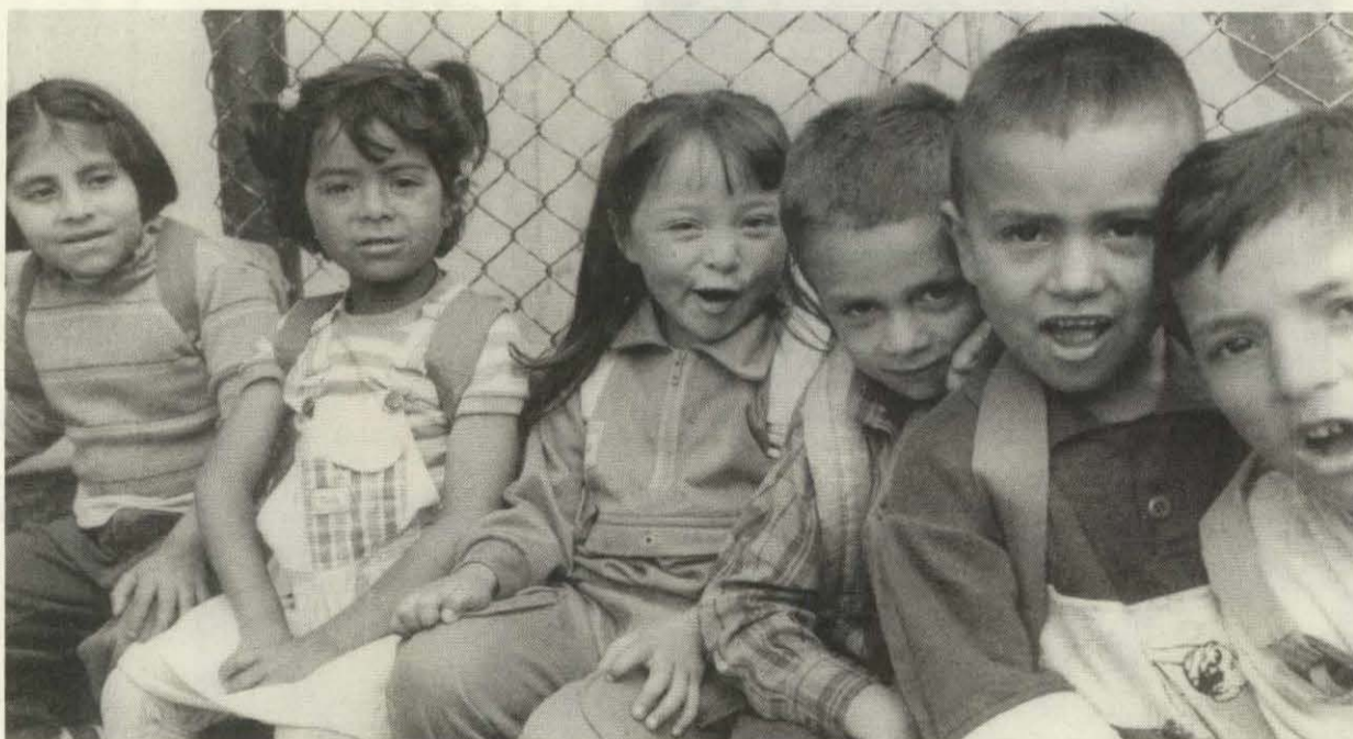
Sólo a partir de un cierto nivel de organización motriz de una coordinación fina de los movimientos del brazo y mano, y de una integración espacio-temporal vivida por el niño, se puede caminar con éxito hacia los aprendizajes escolares.

Para Henri Wallon 7 : " Gracias al movimiento, el niño integra la relación significativa de las primeras formas del lenguaje (el simbolismo). Por el aspecto motor el niño se apropia de una porción de espacio, a través del cual establece los primeros contactos con el lenguaje solicitado. Las nociones de aquí, de allí, izquierda, derecha, delante, atrás, encima, debajo, adentro, afuera, etc., son fundamentales para la orientación del ser humano en el sentido de su autonomía y su independencia."