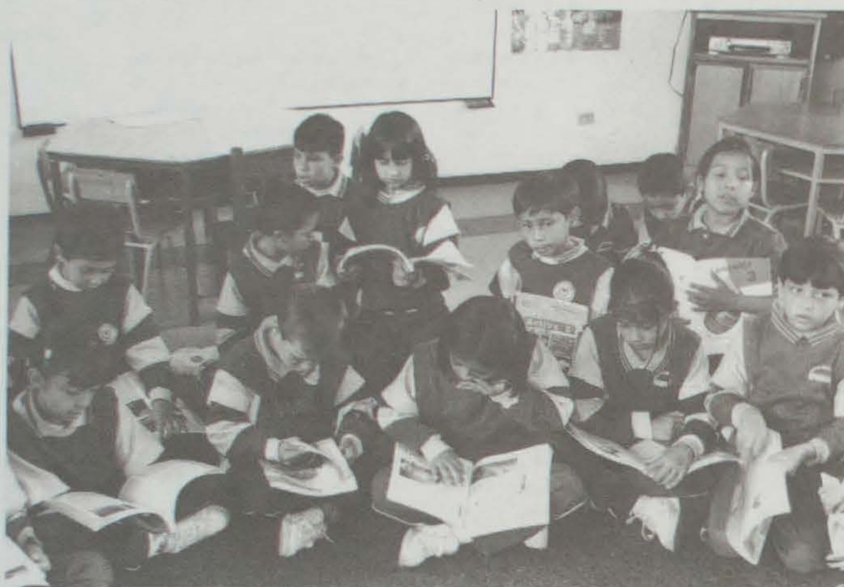
En una escuela de libertad, autonomía, de reflexión, el niño construye el conocimiento.

Doctor en pedagogía y premio extraordinario de doctorado de la Universidad de Barcelona, fundador y primer director del Departamento de Comunicación de la Educación, fundador y director del Instituto de Investigación de Comunicación de la Educación; alumno de Mario Bunge, ha sido biografiado en el Internacional Whiswhoin Education de la Universidad de Cambridge. Autor de más de 200 publicaciones científicas, ha escrito 20 libros, entre ellos: Formación y actualización de la función docente ; Educación no formal , Introducción a la política de la educación . En el Seminario Internacional de Comunicación y Educación realizado por la Universidad Central, participó con la conferencia: Metacomunicación y semántica de los espacios educativos .