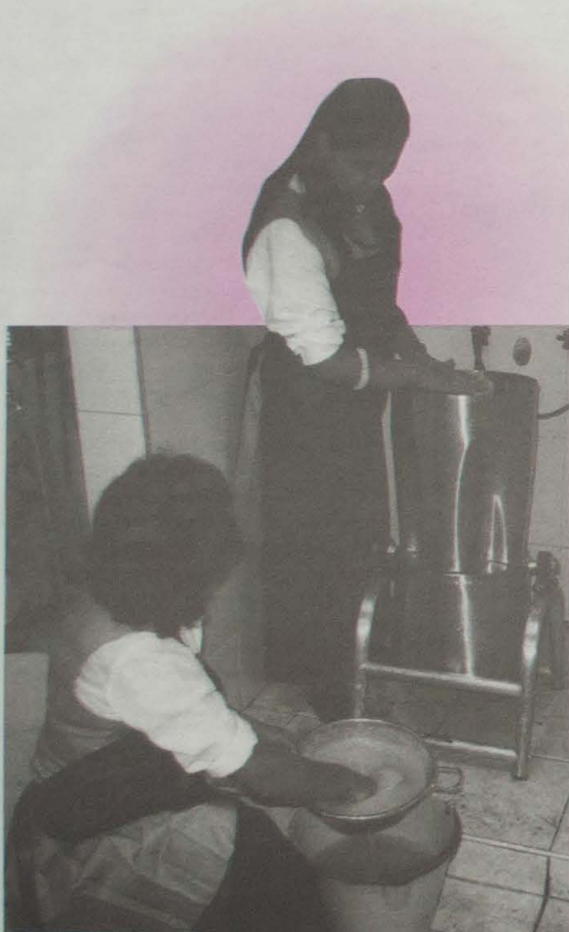
Transformar no sólo el papel sino también los sentimientos y emociones negativos.

Reciclar papel y reciclar sentimientos. Crear fuentes de trabajo y al mismo tiempo, fomentar espacios de reflexión para jóvenes, maestros, maestras padres y madres de familia. Esos son algunos de los propósitos del Taller de reciclaje de papel y aprovechamiento de residuos sólidos de la localidad de Los Mártires.