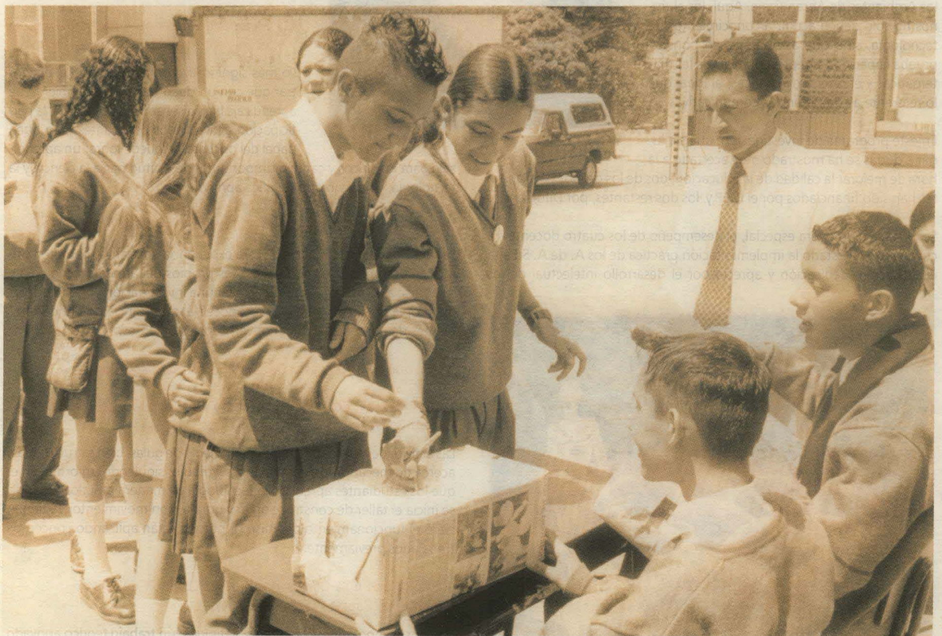
La democracia escolar es uno de los elementos de la formación social que suscita mayor dificultad en las instituciones educativas.

Proyecto de Innovación Pedagógica "Democracia en la convivencia social" financiado por el IDEP mediante convocatoria 04 de 1999.