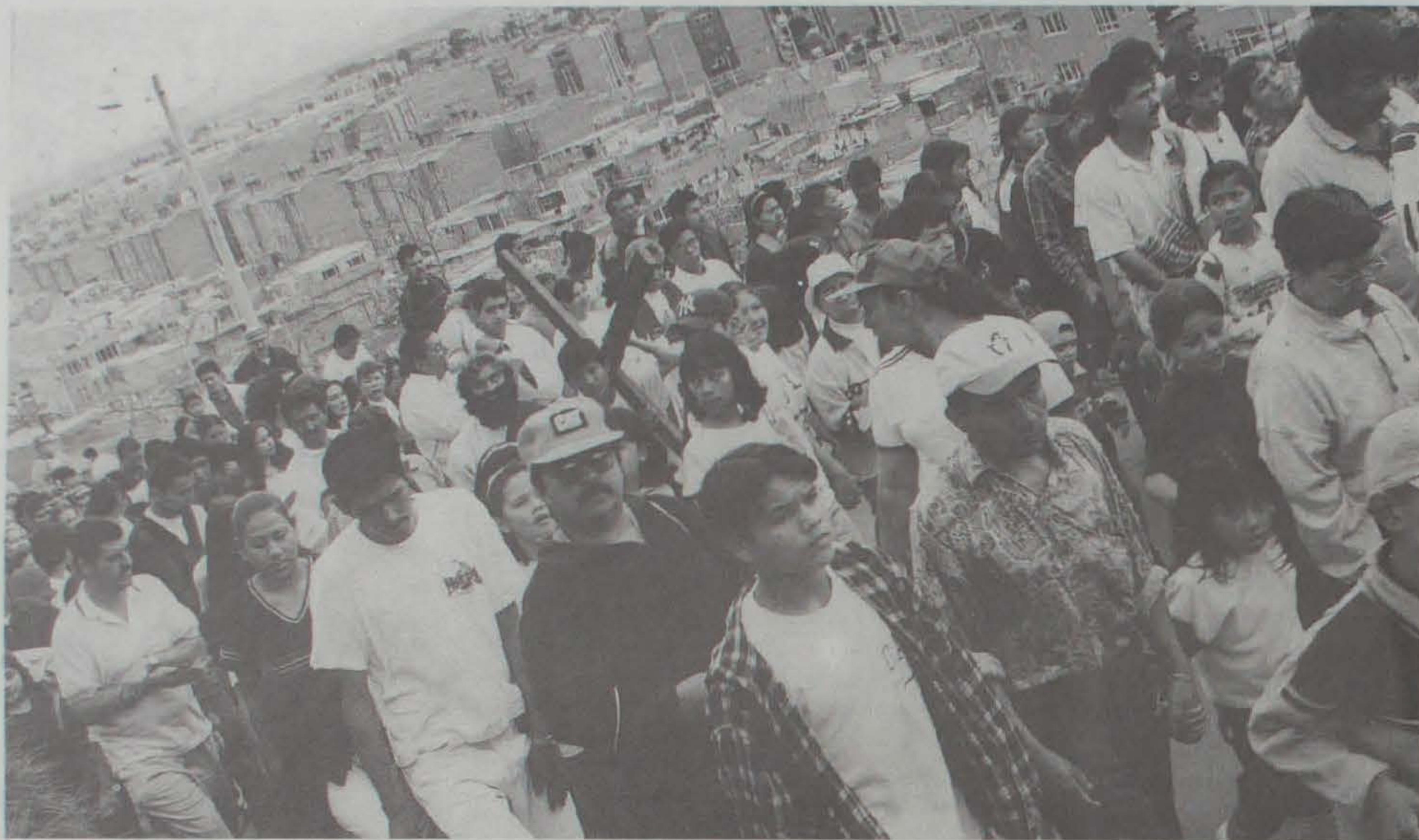
Al lado de la diversidad de prácticas han aparecido algunas problemáticas generadas a partir de las creencias religiosas o antirreligiosas.

Por: Isabel González Licenciada en Ciencias Sociales Instituto Cerros del Sur ICES