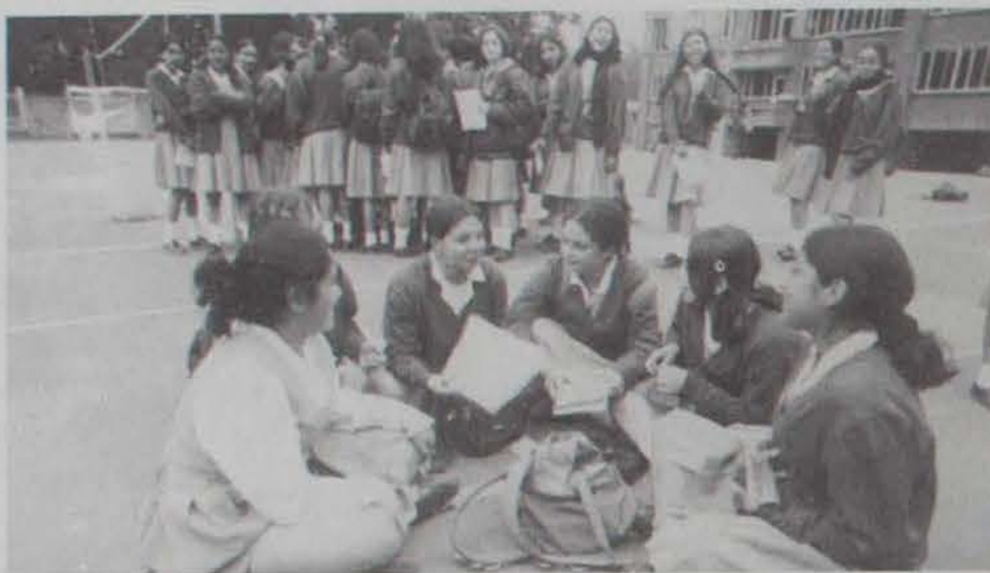
Colegio Carmen Teresiano

La planeación educativa es una oportunidad para pensar en optimizar los procesos administrativos, pero sobretudo los pedagógicos, fundamentales en la vida escolar.