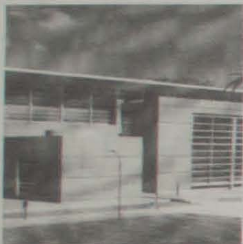
Así será la biblioteca del parque El Tunal, en la que el visitante encontrará zonas de lectura, infantiles, múltiples auditorios y un espacio exclusivo para consultar información sobre Bogotá.

Las grandes extensiones de los cuatro parques más representativos de Bogotá albergarán a partir del año 2000 a Centros de Cultura, en los cuales el visitante podrá disfrutar, además de los servicios de una biblioteca integral, de librerías, papelerías, cafeterías, agencias de viajes, sucursales bancarias y de servicios, estacionamiento para automóviles y bicicletas.