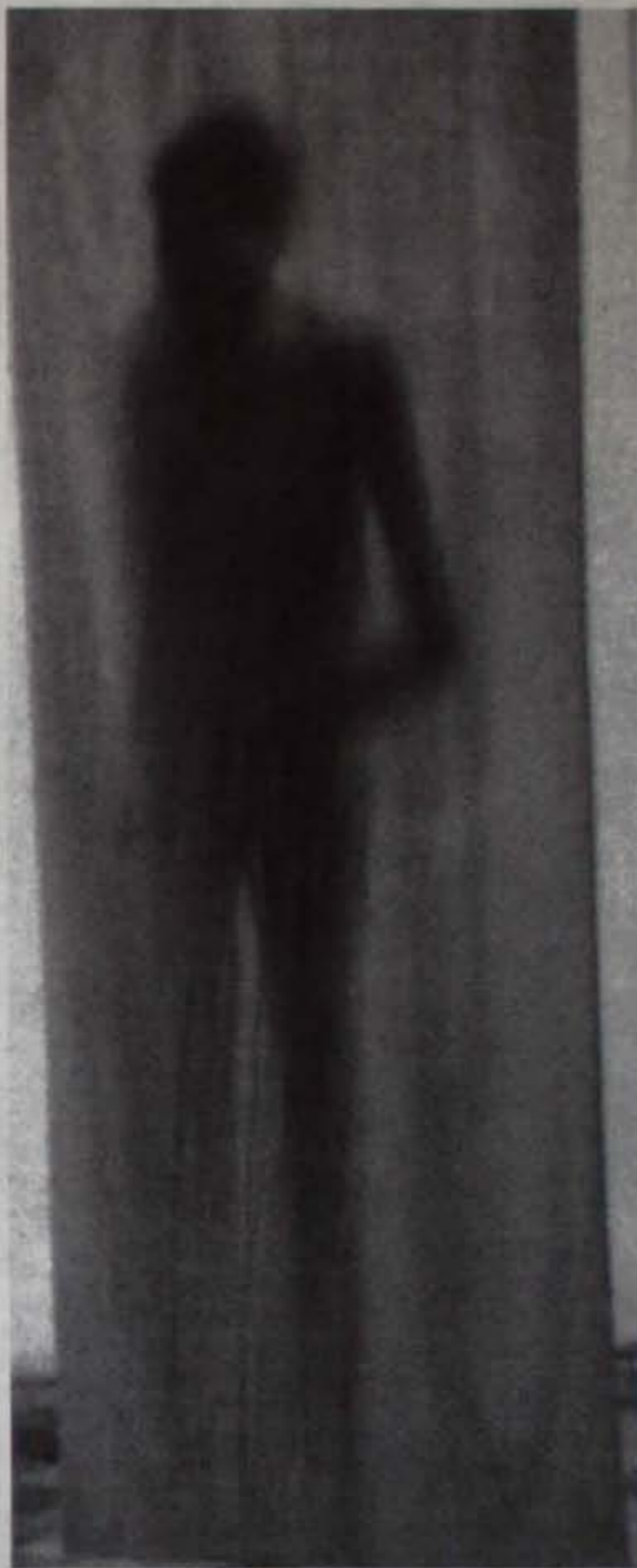
Obra de Oscar Muller, Seres cívicos de balla

Los paradigmas: salud, pedagogía, competencia; como buenos paradigmas, limitan el funcionamiento y generan doctrinas y doctrinantes, esto hace que