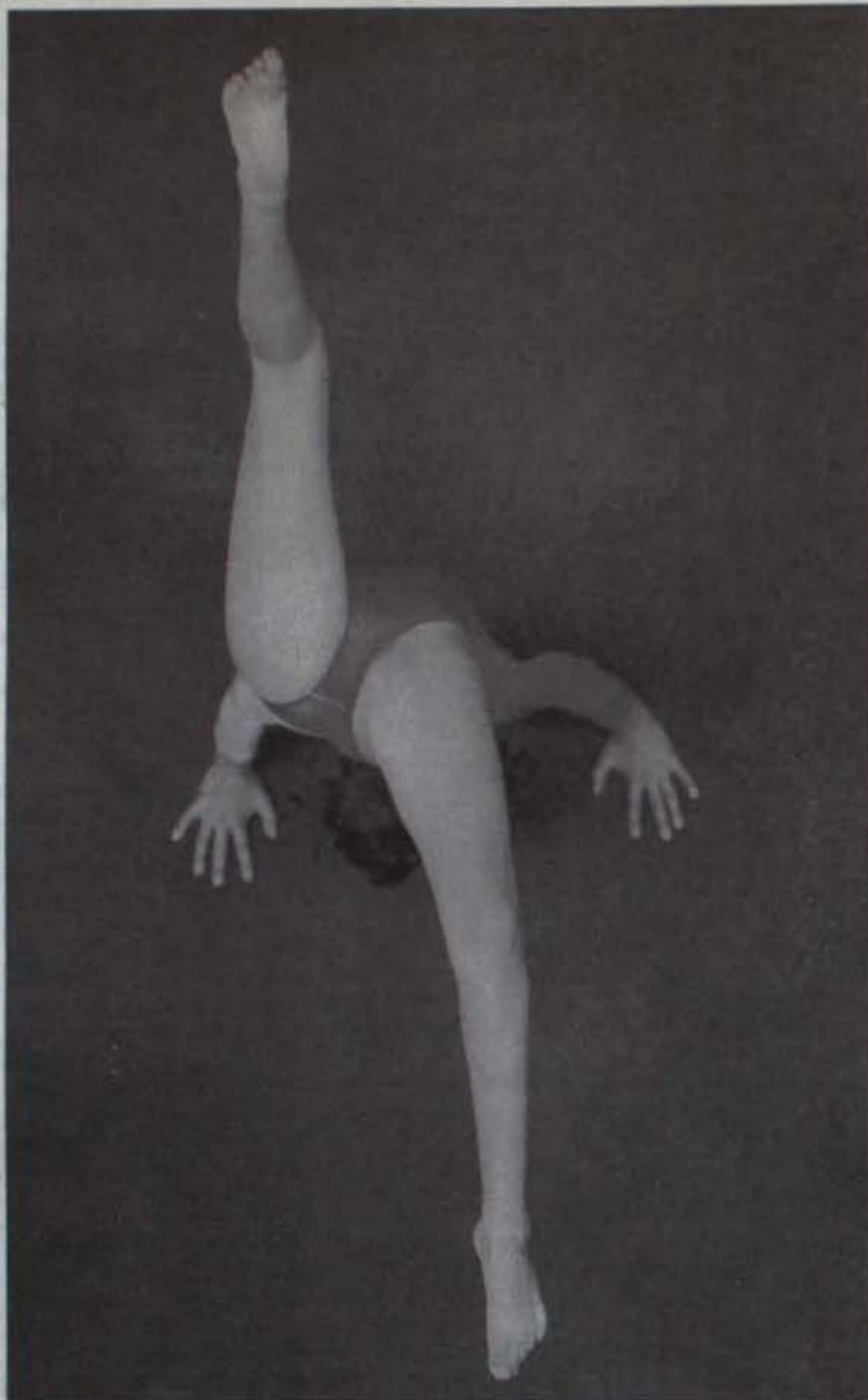
Fotografía: Felipe Caicedo, El espectáculo de la gimnasia, Colombia a través del Tiempo

La Nueva Cultura es una modificación de los valores masculinos, tradicionalmente rectores de la humanidad, dada la historia de las formas vinculación de hombres y mujeres con el mundo de las cosas, de las relaciones y las interpretaciones. Lo femenino penetra y transforma los modelos críticos. Interesa reconocer las diferencias mas no perpetuarlas.