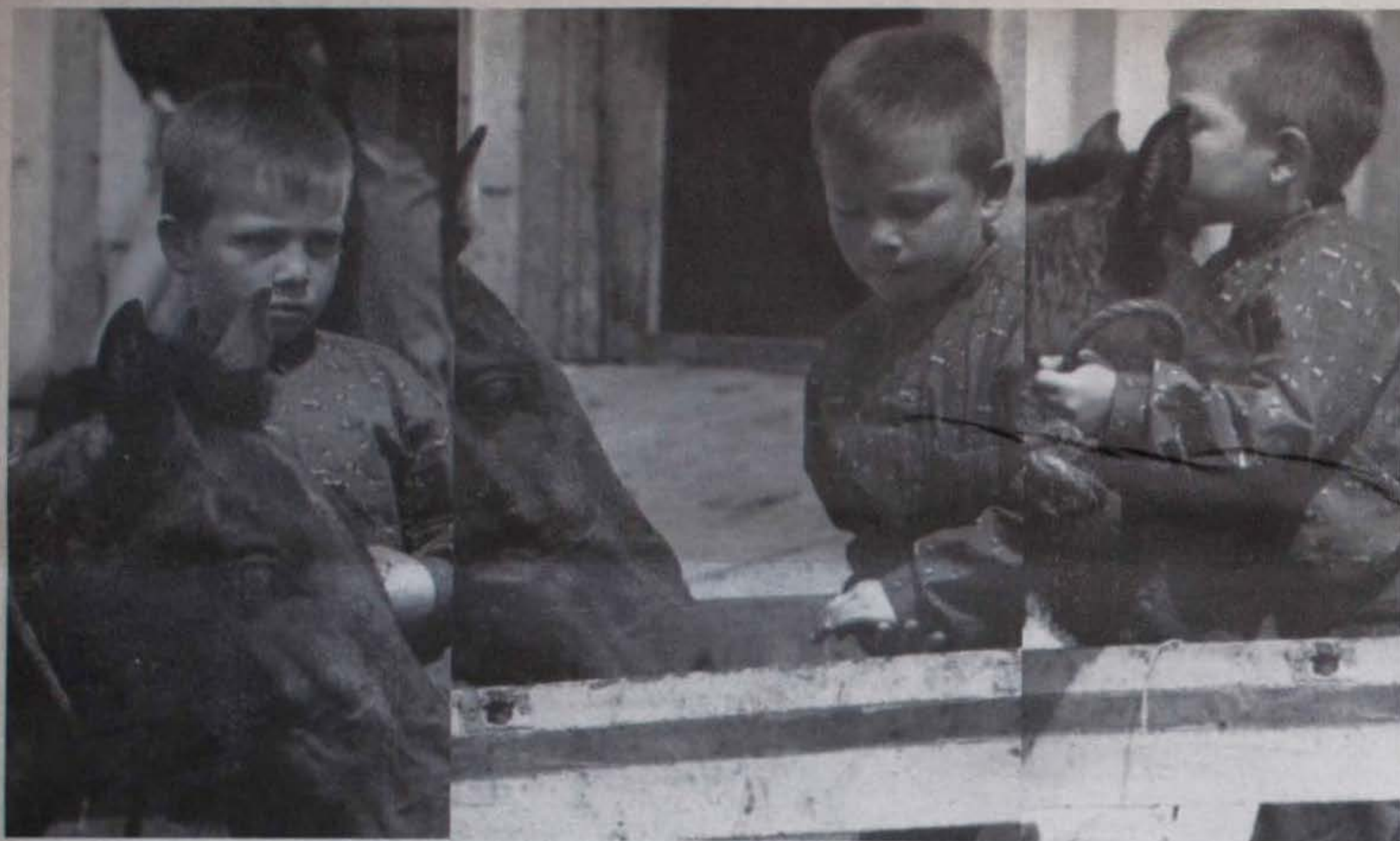
... en la ciudad