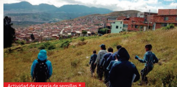
Actividad de cacería de semillas.*