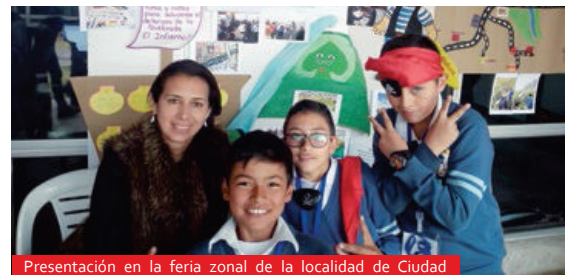
Presentación en la feria zonal de la localidad de Ciudad Bolívar del programa Ondas- Colciencias, donde el grupo fue escogido para pasar a la feria distrital.*