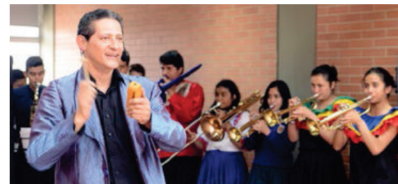
Publicación SED. Los músicos de la paz del Colegio Venecia. 2016.

(Canción. Un país por mejorar, curso 1101 – 2017)