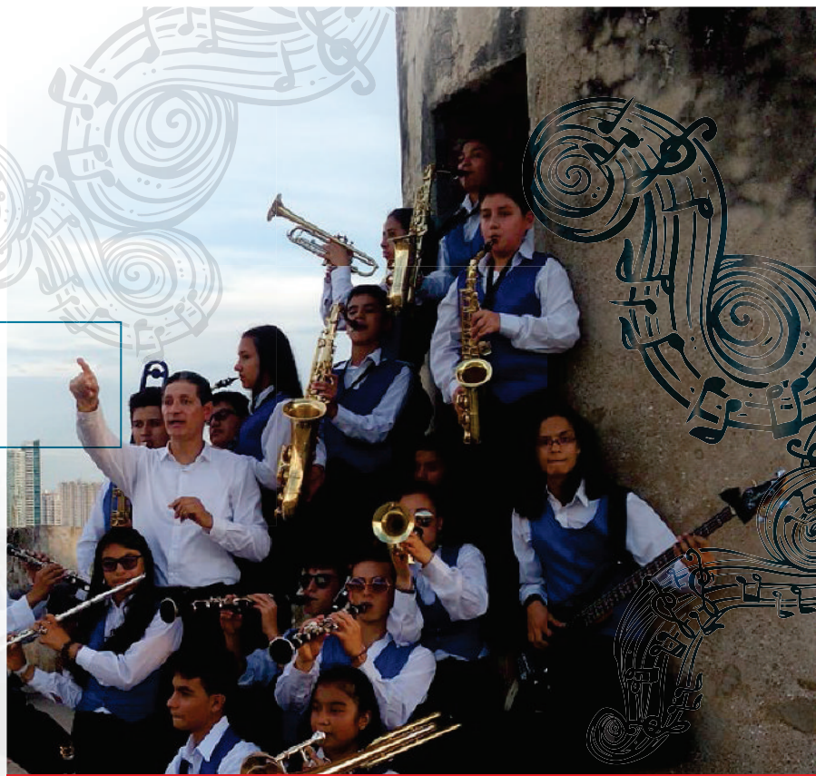
Armonías de paz "Venecia Big Band" en ARNA 2017. Conferencia Cartagena – Colombia.

Por: Daniel Jiménez Jaimes 1 pianodante@hotmail.com