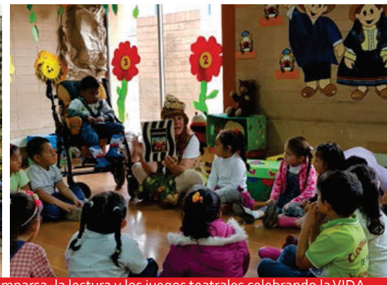
Desde la comparsa, la lectura y los juegos teatrales celebrando la VIDA.