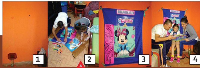
En casa: ubica un lugar, construye tu bibliobolsillo en familia, asegúralo bien en la pared y a disfrutar de cuentos viajeros diarios.