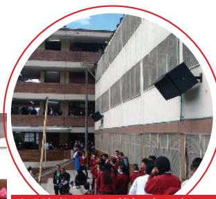
Actividad institucional liderada por los estudiantes: observación del eclipse, formando líderes.

Por: Bladimir José Porto Gómez 1 Familia 1101 JT Colegio Fabio Lozano Simonelli bladimirporto@javeriana.edu.co