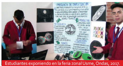
Estudiantes exponiendo en la feria zonal Usme, Ondas, 2017.