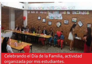
Celebrando el Día de la Familia, actividad organizada por mis estudiantes.