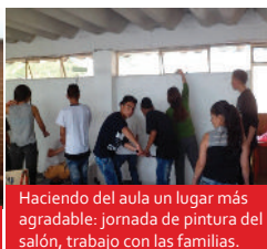
Haciendo del aula un lugar más agradable: jornada de pintura del salón, trabajo con las familias.