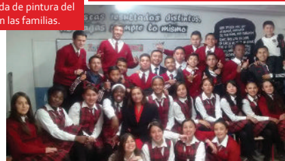
Adecuando el aula con frases inspiradoras.

En 2017 el proyecto amplió el Club de astronomía, pasó de adelantarse solo en algunos cursos a ser una apuesta institucional en la que participan