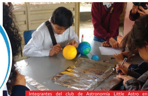
Integrantes del club de Astronomía Little Astro en diferentes actividades.