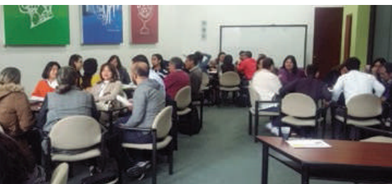
► Mesas de trabajo por temas de interés.