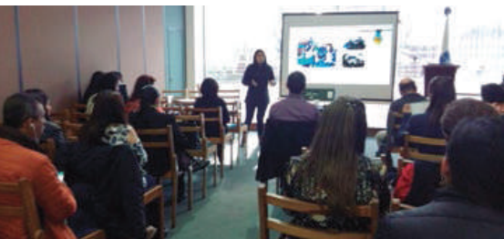
► Socialización de experiencias y conferencias de expertos.