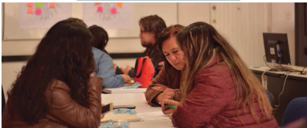
► Estrategias para la planeación participativa.

Posteriormente, a partir de los diversos intereses de los docentes y las instituciones en torno a la evalua-