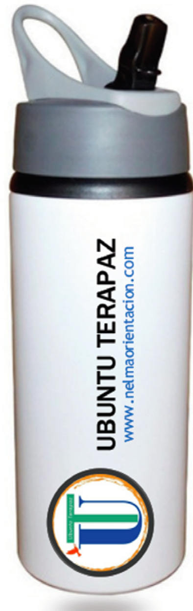
Incentiva MqI colegio Nelson Mandela IED

El mentor es un colega que comparte el interés social por la educación integral, pública y de calidad; es un asistente que acompaña las iniciativas de sus colegas inspiradores comprometidos con la transformación de las prácticas pedagógicas, profesionales probos de quienes siempre se aprende significativamente. Con el programa de Maestros y Maestras que Inspiran se ratifica la afirmación de Ballén (2020) “podemos desarrollarnos entre pares, podemos aprender de los mejores y los mejores son también colegas, no son expertos ajenos a la escuela” (p. 4).