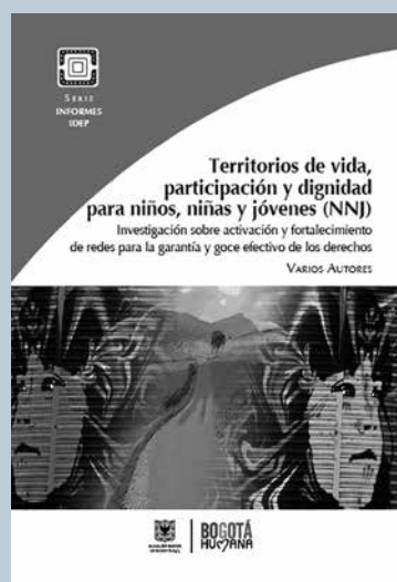
Territorios de vida, participación y dignidad para niños, niñas y jóvenes (NNJ). Investigación sobre activación y fortalecimiento de redes para la garantía y goce efectivo de los derechos.

La publicación presenta la articulación de la educación media con la educación superior, desde la caracterización de las tendencias, los modelos y las experiencias, en el plano internacional, nacional y local. Además, la caracterización de prácticas de emprendimiento en colegios oficiales del Distrito Capital. Producción colectiva de maestros.