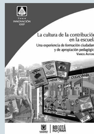
La cultura de la contribución en la escuela. Una experiencia de formación ciudadana y de apropiación pedagógica

Una investigación que responde a la inquietud ética, política y pedagógica que plantea la vulneración de los derechos de los niños, niñas y jóvenes. De ahí que ha recopilado, propuesto y validado herramientas pedagógicas que tienen la potencialidad de colaborar en la construcción de territorios en los que impera el goce efectivo de sus derechos y que constituyen así insumos de lineamientos pedagógicos que pueden orientar programas y políticas públicas.