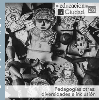
Revista Educación y Ciudad 26

La revista 25, sobre Nuevos Lenguajes, Cultura Digital y Educación, invita a reflexionar por la presencia de los nuevos lenguajes y la tendencia dominante a su digitalización en la contemporaneidad, hecho que se produce al lado de varias transformaciones (tecnoc)ulturales: el resurgimiento de una cultura de la (hiper)visualidad, la configuración de nuevas formas de circulación, autoría y archivo de saberes, la exaltación de la sensibilidad y de la experiencia estética, y las nuevas formas de consumo de información.