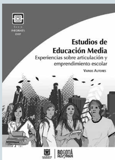
Estudios de educación media. Experiencias sobre articulación y emprendimiento escolar

La publicación presenta la articulación de la educación media con la educación superior, desde la caracterización de las tendencias, los modelos y las experiencias, en el plano internacional, nacional y local. Además, la caracterización de prácticas de emprendimiento en colegios oficiales del Distrito Capital. Producción colectiva de maestros.