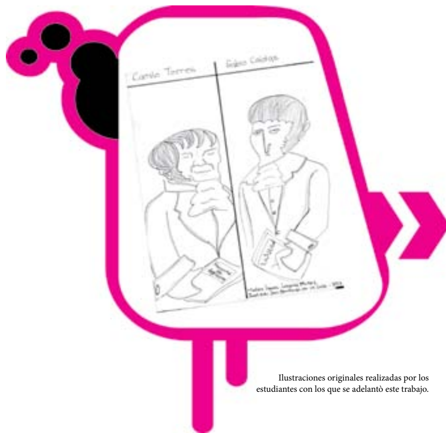
Ilustraciones originales realizadas por los estudiantes con los que se adelantó este trabajo.

Las opiniones están divididas, ya que algunos historiadores hablan de que se debe celebrar la decisión de separarse o independizarse de España, ese 20 de julio al mediodía e iniciar la renovación de la sociedad colonial; otros están de acuerdo en, simplemente, conmemorar el 20 de julio, ya que el impulso independentista fue motivado en la misma España, para sabotear el poder del Rey usurpador falso.