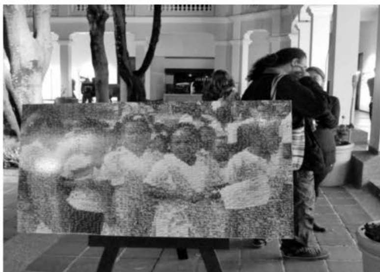
De dónde vengo voy . Una experiencia sobre arte, pedagogía y desplazamiento en la escuela