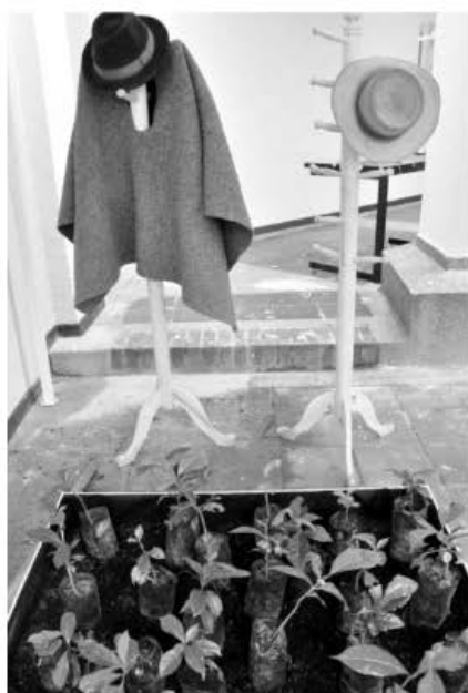
De dónde vengo voy. Una experiencia sobre arte, pedagogía y desplazamiento en la escuela