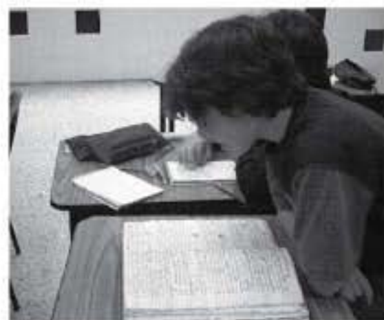
Estudiante de 5º grado haciendo lectura directa de un documento.

"Aprendí a leer paleografía, a distinguir y a entender signos que nunca antes había visto".