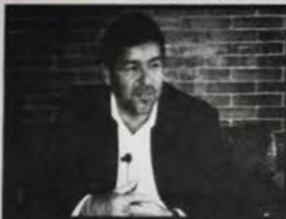
Jorge Londoño (JL) Gobernador de Boyacá

1. JL. La investigación ocupa un primer lugar. En proyectos educativos, tenemos alrededor de unas 250 investigaciones en el Programa Ondas; en eso somos líderes en el país. Esto es algo que hemos querido fomentar y se ha hecho con el Gobierno nacional, para hacerles entender a los niños, niñas, y jóvenes que la investigación no es exclusivamente propiedad de algunos prohombres. La investigación hay que