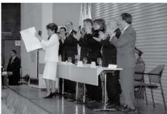
Un poco de nostalgia: la imagen registra la entrega del Galardón a la Excelencia 2004-2005, obtenido por el Colegio Distrital Carlos Galán Samierito.

Premiar la calidad educativa es hacer un reconocimiento a las mejores condiciones de enseñanza y aprendizaje que los colegios galardonados ofrecen a los niños, niñas y jóvenes; es premiar la creatividad, la imaginación de los buenos maestros y directivos, que saben cuándo y qué enseñar,