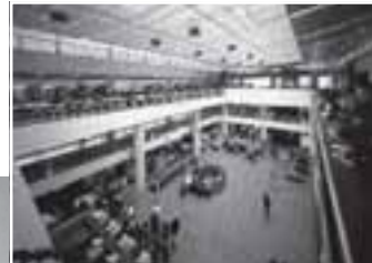
Las bibliotecas El Tintal (arriba), y Virgilio Barco fortalecen el sistema educativo de la Capital.

La idea es que los maestros y las maestras del diplomado, los participantes en el ciclo de cine y quienes por su cuenta han hecho estudios sobre democracia y derechos humanos se enreden en este cuento, para lograr un diálogo más fluido sobre este tema de vital importancia para la creación de un clima de convivencia nacional.