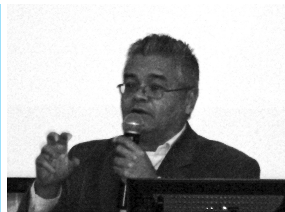
Encuentro Internacional sobre Estudios de Fiesta, Nación y Cultura

“Vivimos en un mundo de naciones que deben aprender a convivir y a superar sus diferencias con el diálogo, lo cual exige superar el tradicional discurso nacionalista, donde la construcción de la identidad siempre tomó como referencia el conflicto y la oposición con el vecino”.