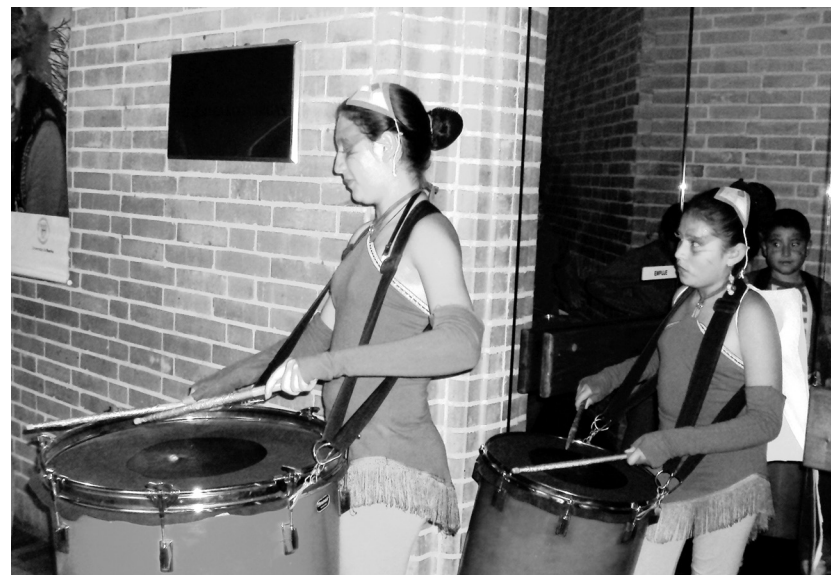
Encuentro Internacional sobre Estudios de Fiesta, Nación y Cultura.

parten experiencias significativas, cuyas formas de ser contadas, van contribuyendo a que otros evolucionen procesos similares. De esta manera, se construye una realidad