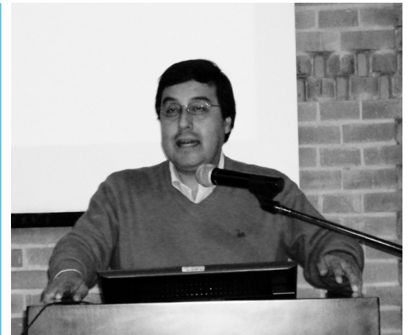
Encuentro Internacional sobre Estudios de Fiesta, Nación y Cultura.

El mundo vive estos fenómenos, con sus matices, cada cierto tiempo. En alguna medida eso fue la Guerra Fría, con una influencia determinante de dos grandes potencias donde parecía casi obligatorio tener que sumarse a una de ellas y ceder parte de la soberanía, tan apreciada durante la emancipación a comienzos del siglo XIX. En la actualidad tenemos una clara composición mixta de las naciones, tanto en lo racial como en lo cultural. Un porcentaje no despreciable de norteamericanos son de origen hispanoamericano, España ha recibido otro tanto, la televisión está furentemente norteamericanizada, y lo mismo ocurre con los medios de comunicación más recientes, como twitter, facebook y otros. Por eso la afirmación nacional de estos tiempos tendrá una lógica distinta, donde tiene importancia la historia, el lenguaje, el deporte y otras tantas cosas. Esto puede tomarse como un problema o como una oportunidad, y en lo personal estoy convencido de que lo mejor es adecuarse a la realidad, querer mucho lo propio, pero con capacidad para apreciar la belleza que hay en otras culturas y ser capaces de participar activamente en la sociedad mundial contemporánea. Hoy es posible afirmar que se han fortalecido los nacionalismos en América Latina, no sólo