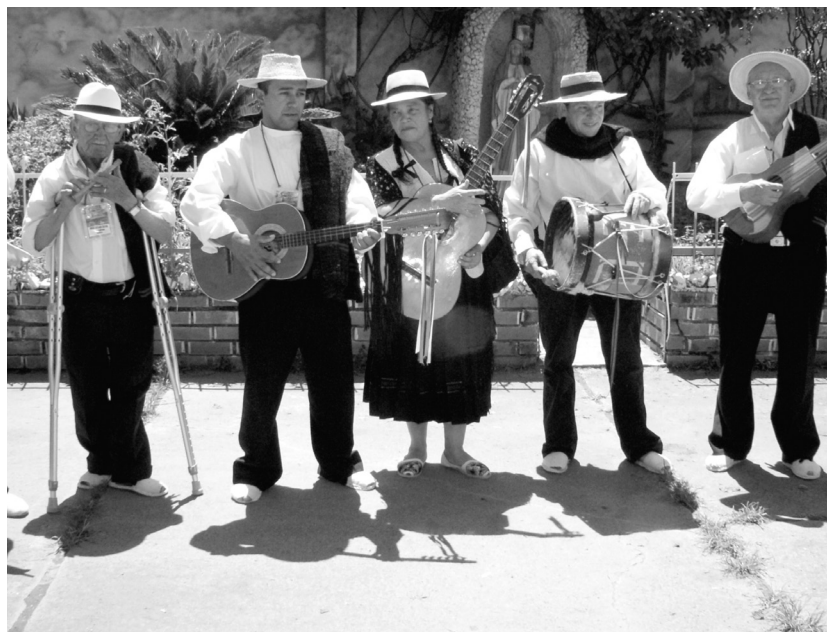
Festival "Mono Nuñez" 2010.

Regresaba a la Universidad Nacional en la condición de un "intelectual" no sólo destetado del poder y acaso detestado por los poderes, al por mayor y al detal,