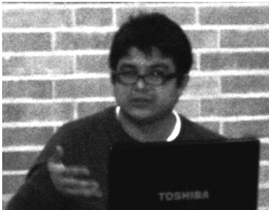
Encuentro Internacional sobre Estudios de Fiesta, Nación y Cultura

NC: Este es un campo de suma importancia en algunos Festivales de Música en Colombia, puntualmente toque este tema, en un capítulo de mi tesis de Maestría en Historia, ya que en el Festival de Música Andina Colombiana Mono Núñez, existe desde 1985 la Academia Funmúsica, en 1992 se realizó la etapa de prueba del bachillerato musical, y el 1 de febrero de 1993 se inició formalmente. La primera promoción de bachilleres se proclamó en el 2002,