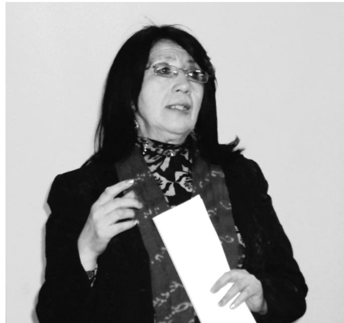
Encuentro Internacional sobre Estudios de Fiesta, Nación y Cultura

LIMC: El aporte a la convivencia ciudadana, al conocimiento y proyección del patrimonio creativo de la fiesta, como a la práctica cultural misma y al constructo de nuevos imaginarios o cosmovisiones que reconozcan, identifiquen, practiquen y difundan la fiesta, es el máximo legado que