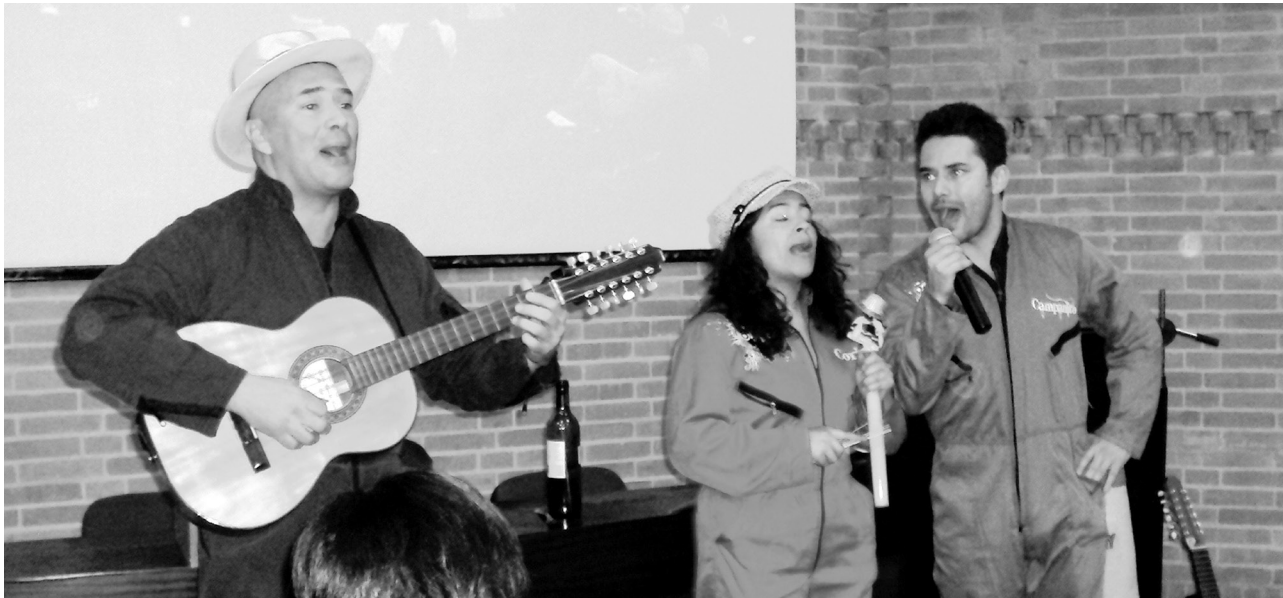
Encuentro Internacional sobre Estudios de Fiesta, Nación y Cultura.

Esto evidencia el impacto artístico y cultural sobre la comunidad educativa y la aceptación positiva de la misma. Así mismo, se desarrollaron procesos artísticos-cognitivos en los educandos como la apreciación estética, el