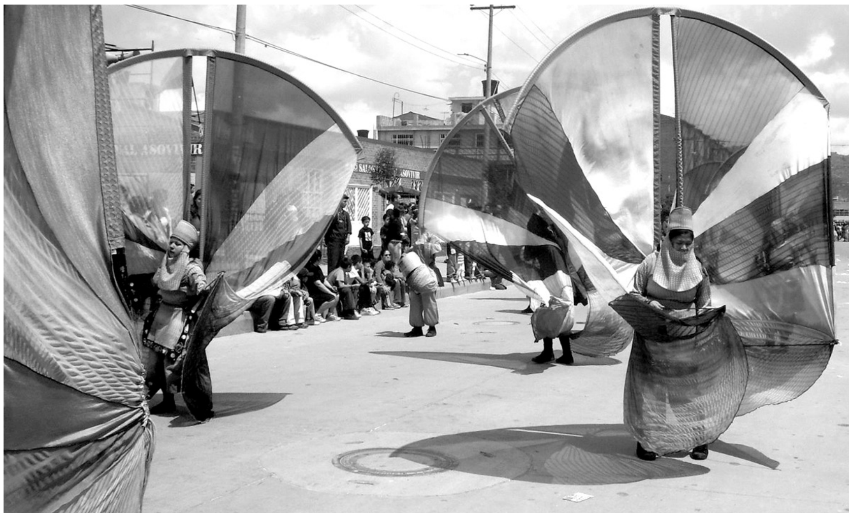
“Festival de Barranquilla, 2008”.

RR: La Venezuela de hoy está fundada en la Constitución de 1999, surgida de un proceso constituyente en el que participe como diputado electo por el estado Lara, con la convicción de que estábamos refundando la república sobre un nuevo pacto social con miras a construir