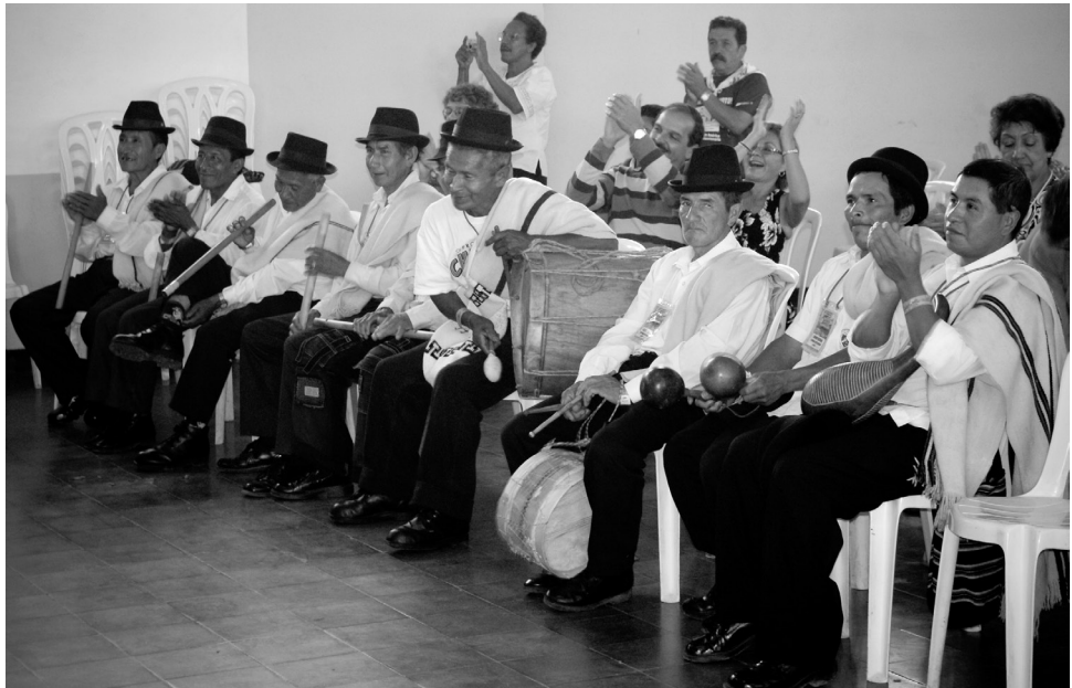
Festival “Mono Núñez” 2010.

Incluso esta postura ha abierto una discusión en diferentes museos en el mundo, sobre ¿Cuál es el papel de los museos en la construcción del discurso histórico oficial y la memoria