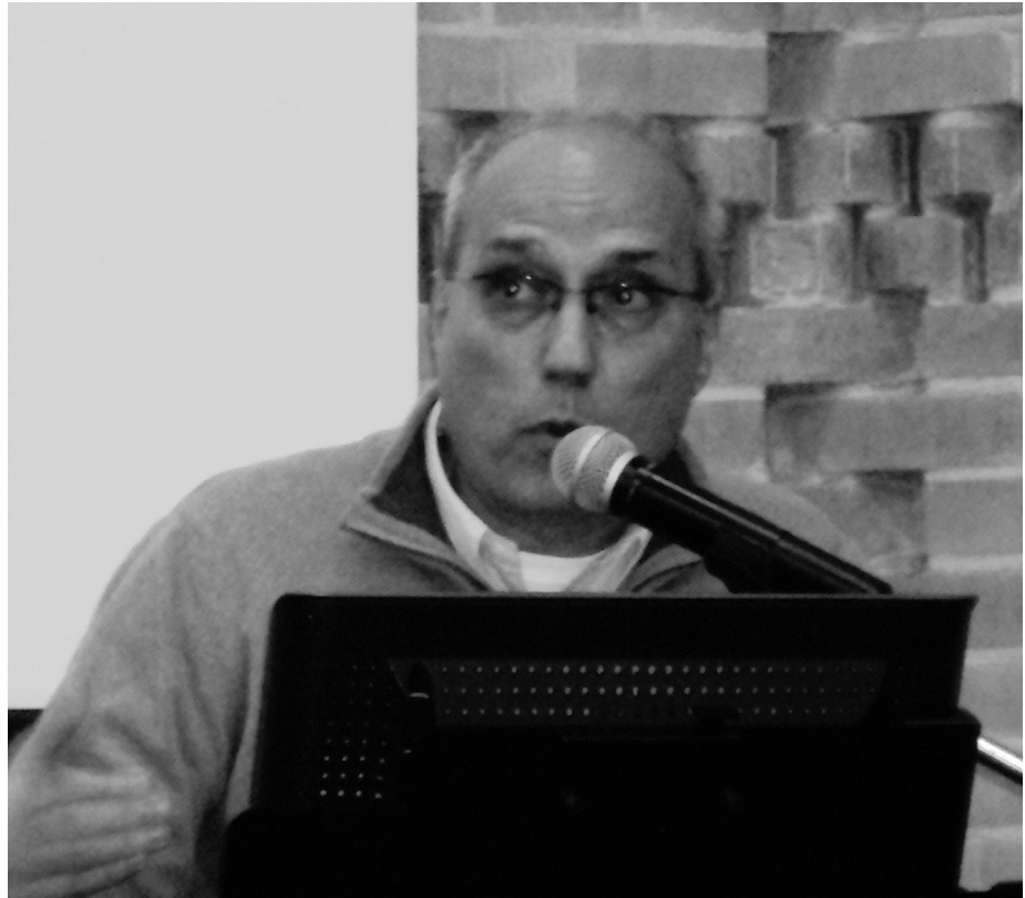
Encuentro Internacional sobre Estudios de Fiesta, Nación y Cultura

MAU: De los libros que Usted ha escrito sobre Fiesta, ¿cuál (o cuáles) de ellos recomendaría