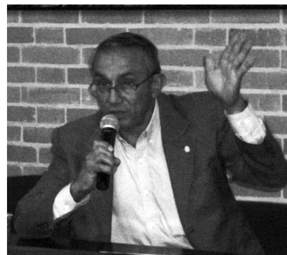
Encuentro Internacional sobre Estudios de Fiesta, Nación y Cultura.

MAU: Nación y caricatura, así como Fiesta y Nación o Cultura y Fiesta, se traslapan en inter-