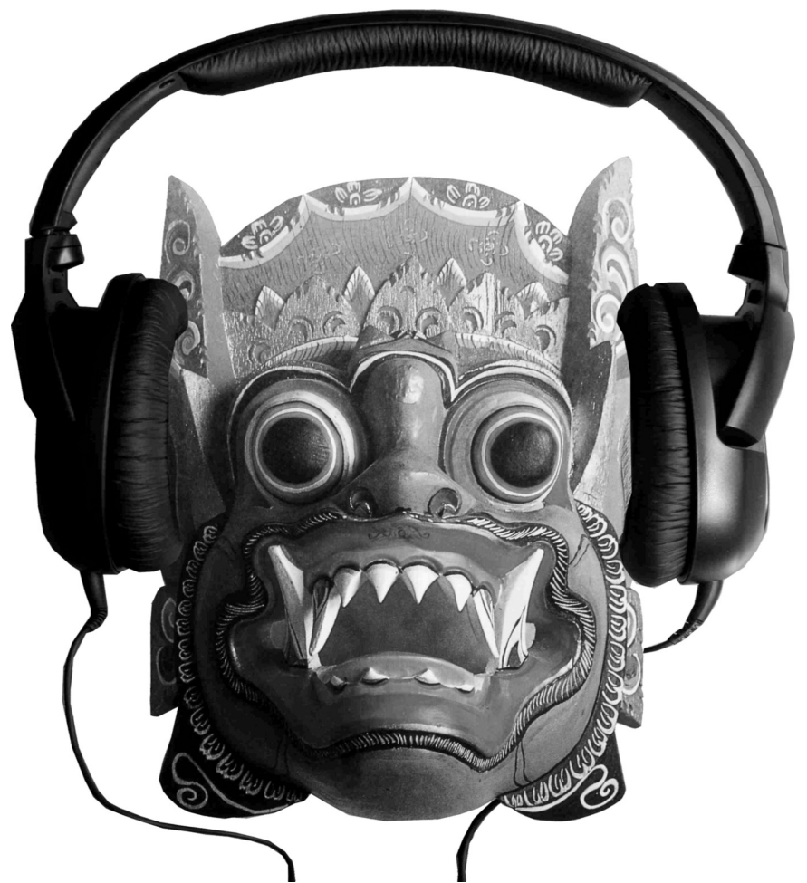
PÓSTER-ÍCONO DEL ENCUENTRO INTERNACIONAL SOBRE ESTUDIOS DE FIESTA, NACIÓN Y CULTURA

"Los diarios, o, mejor, los nocturnos, como fuente del cuidado de sí, como las plegarias y la poesía, tan imbuidas del espíritu del carnaval, tan permeados de su creatividad y de sus metáforas, han sido un viático para solazar la esterilidad de los mediodías calcinantes de la amada patria".