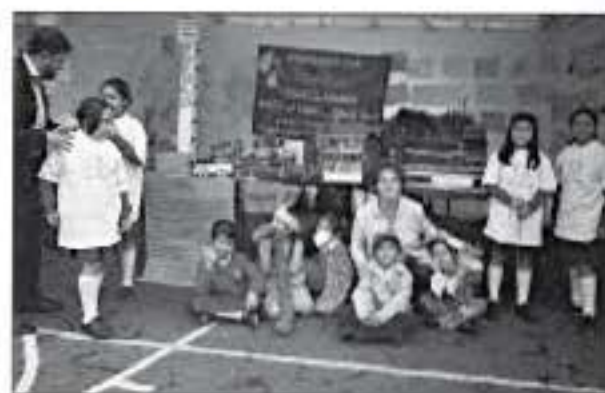
Estudiantes de preescolar del Colegio Lorencia Villegas de Santos caracterizando a los personajes de las cartillas de la serie Serpiente de agua; y estudiantes de cuarto de primaria creadores de la maqueta que enseña el recorrido del agua desde el páramo hasta la casa.

Dichas expediciones afianzaron aprendizajes adquiridos con el uso de estrategias y materiales didácticos aportados por la EAAB, como función de títeres, mapas, acompañamiento en el PRAES y la Serie de tres cartillas Serpiente de agua. Los relatos, actividades de investigación, análisis, interpretación y argumentación, junto con los ejercicios lúdicos que ofrece cada cartilla, permitieron el desarrollo de competencias y apropiación de saberes pertinentes a cada nivel educativo y área del conocimiento.