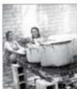
El típico paseo de cila, en la Bogotá de los años sesenta. La fotografía hace parte del álbum fotográfico del Museo de Bogotá.